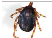
3d. Hyalomma marginatum