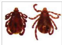
3b. Rhipicephalus sanguineus