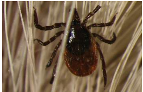
2. Ixodidi (zecche dure)