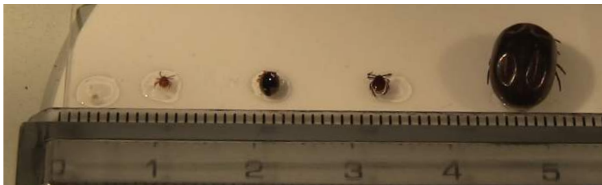
Stadi vitali delle zecche. A partire da sinistra: larva, ninfa, ninfa ingorgata, femmina e femmina ingorgata.

Le zecche non hanno antenne o ali. Sono caratterizzate da un corpo tondeggiante (non hanno la suddivisione in capo, torace, addome, tipica degli insetti) e dalla presenza di 4 paia di zampe; l'unica eccezione è la larva, più piccola (1 mm) che ne ha 3 paia. Hanno un rostro con dei dentelli che serve loro per perforare la cute. La colorazione varia dal rosso-mattone ( Rhipicephalus sanguineus ) al marrone scuro.