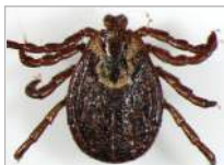
3c. Dermacentor marginatus