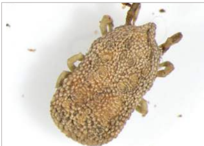
1. Argasidi (zecche molli)

Le zecche appartengono allo stesso gruppo tassonomico dei ragni e scorpioni e sono dello stesso ordine degli acari. Esistono circa 900 specie di zecche, tutte parassite che si nutrono di sangue. In Italia sono presenti 40 specie suddivise in due famiglie: Argasidi (7 specie) e Ixodidi (33 specie). Gli argasidi sono anche conosciuti come zecche molli e parassitano soprattutto gli uccelli, mentre le zecche dure parassitano tutti i vertebrati, in particolare i mammiferi. Le differenze biologiche e morfologiche sono mostrate nelle figure seguenti (fig.1: argasidi; fig.2: ixodidi).