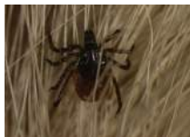
3a. Ixodes ricinus

Limitatamente alle zecche dure, le specie più comuni sono la zecca dei boschi ( Ixodes ricinus ) (fig. 3a) e la zecca del cane ( Rhipicephalus sanguineus ) (3b). Altre specie meno comuni sono Dermacentor marginatus (3c) e Hyalomma marginatum (3d).