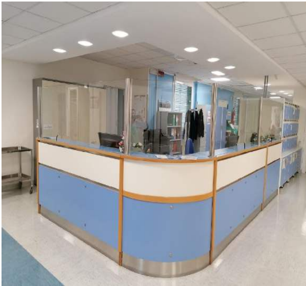
Front Office 2