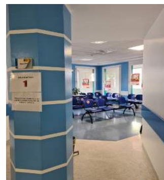
Sala d'attesa n. 1