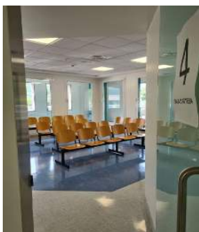
Sala d'attesa n. 4

Sono presenti tre sale di attesa (sala di attesa n. 1 e sala di attesa n. 2 e sala d'attesa n. 4