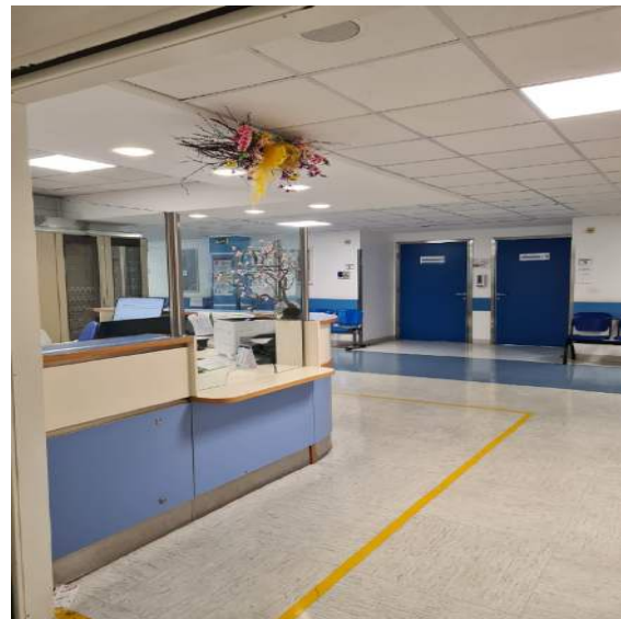
Front Office 1